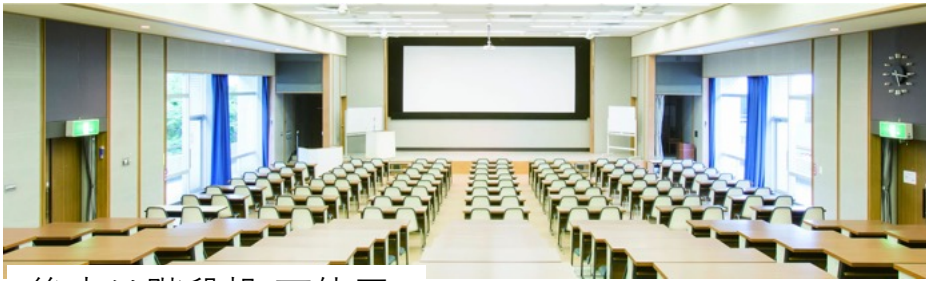
後方は階段机(不使用)